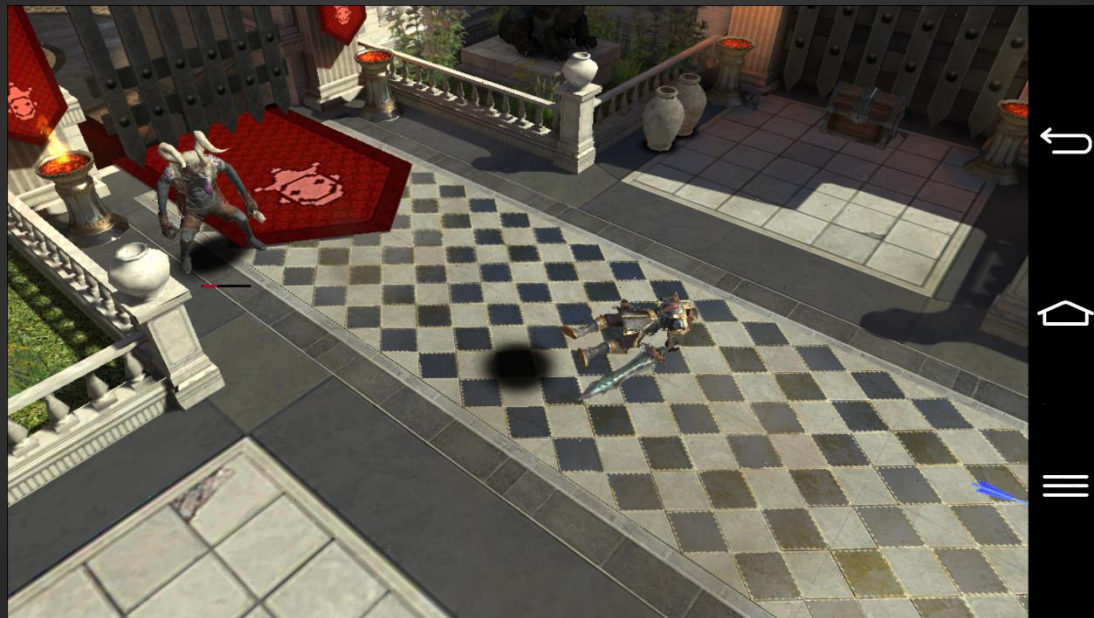
초기 전투 화면